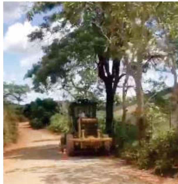
Patrol contratada pela administração realizando abertura e melhorias na estrada do Barbosa

O valor pago por hora no uso do equipamento contratado poderiam ser investidos em necessidades de serviços públicos nos locais carentes da cidade.