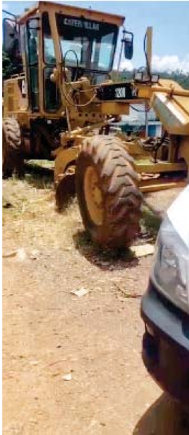
Patrol da Prefeitura parada dentro da garagem