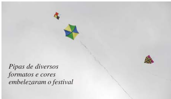
Pipas de diversos formatos e cores embelezaram o festival