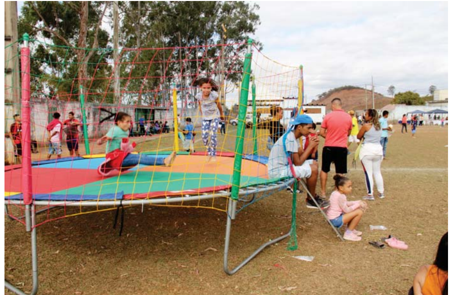
Crianças se divertiram durante todo o dia