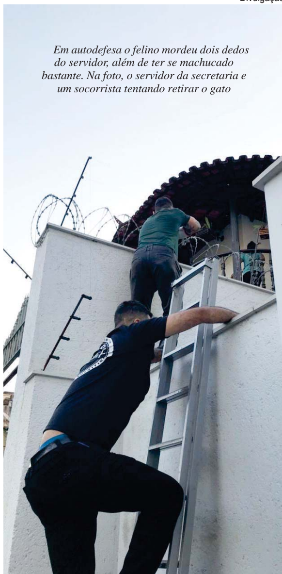
Em autodefesa o felino mordeu dois dedos do servidor, além de ter se machucado bastante. Na foto, o servidor da secretaria e um socorrista tentando retirar o gato

Ao questionar os servidores do meio ambiente presentes se a demanda de resgate de animais realmente pertence ao órgão, haja vista que os funcionários não possuem treinamento, formação técnica e nem equipamentos de proteção individual para atendimento a esses casos, esses informaram que atualmente foi aprovado pela Câmara Municipal o Código Municipal de Direito dos Animais no município de João Monlevade, passando para a Secretaria de Meio Ambiente a responsabilidade de recolhimento de animais em risco.