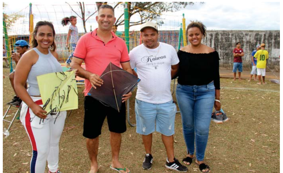
O festival atraiu até os adultos