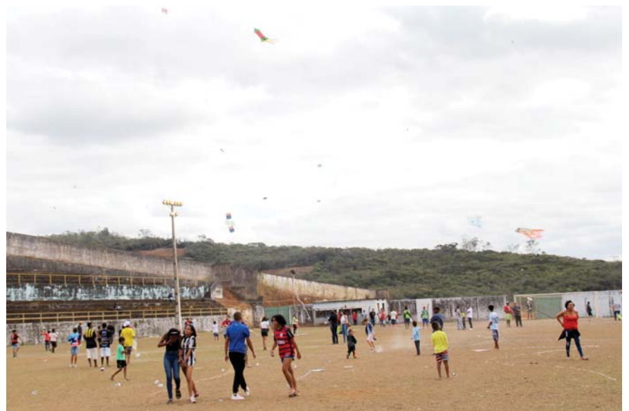
O Festival de Pipas aconteceu no Estádio Modestão