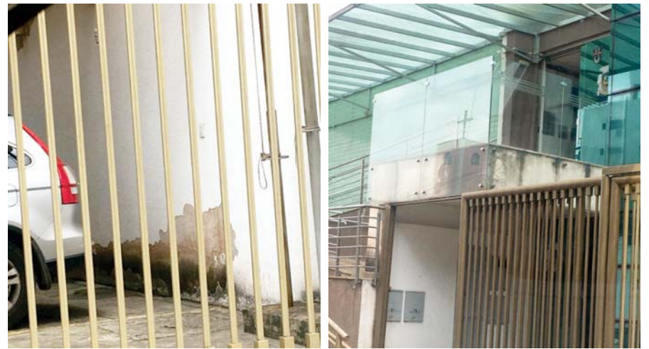
A garagem da repartição pública está descascando a pintura e mofo por toda parte. Já na entrada da Câmara, no segundo pavimento é nítido a presença de infiltrações e mofo por falta de manutenção

Restando menos de três meses para encerrar o ano de 2022, a diretora da câmara mesmo que quisesse, não conseguiria mais superar as dificuldades. O dinheiro que resta em caixa para os gastos até o mês de dezembro só existe em razão da boa conduta das competentes servidoras dos setores que lidam com as finanças do Legislativo. A direção