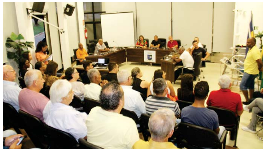
A audiência ocorreu no Legislativo de Bela Vista de Minas, com a presença de um enorme público e representantes do município