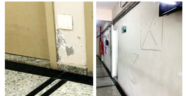
A repartição interna da Câmara com parede estourada e com marcas de fitas de adesivos deixando paredes sujas

dicados e excluídos, com favorecimentos da diretora a outros funcionários, com o desvio de funções.