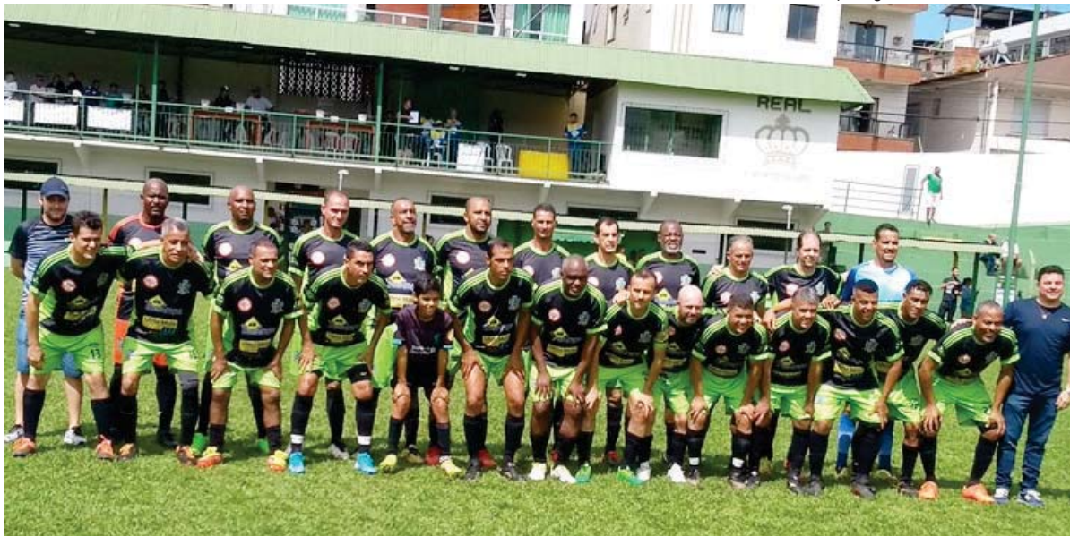
Cinquentão de Monlevade, campeão invicto no AMEPI OLÍMPICO