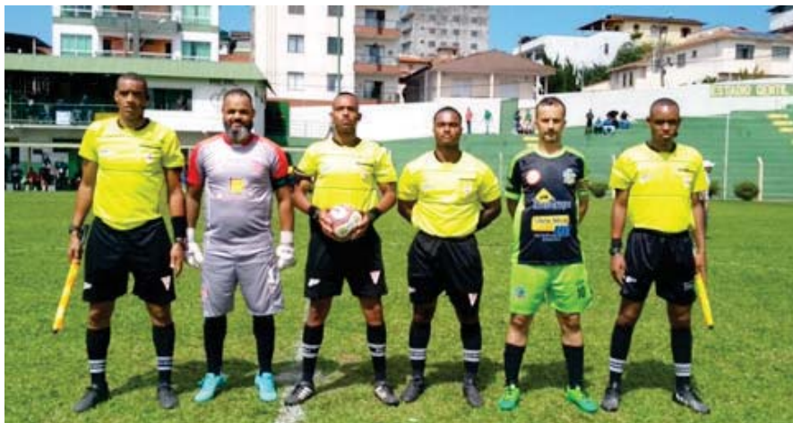
Arbitragem e capitães da partida final

A equipe 50+ de futebol, representando Monlevade, foi campeã do Projeto AMEPI OLÍMPICO, promovido pela Associação dos Municípios da Microregião do Médio Piracicaba (AMEPI) presidida por Fernando Rolla, atual prefeito de São Domingos do Prata, com total apoio da Secretaria Municipal de Esportes. Objetivando ao incentivo da prática esportiva e a atividade física, o projeto começou com a realização de partidas de futebol nas categorias Amador e Cinquentão. Monlevade, Itabira, Bela Vista de Minas, Rio Piracicaba, Nova