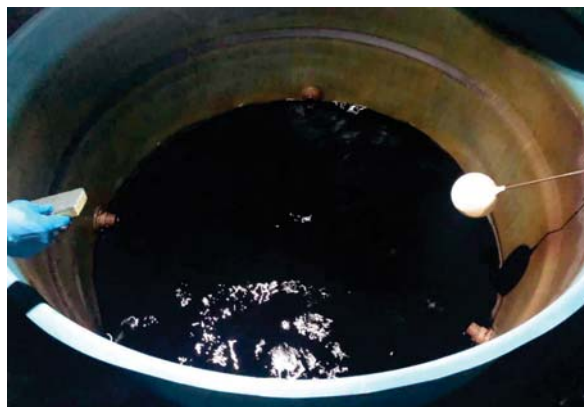
O estado em que se encontravam as caixas d'água do Legislativo de João Monlevade há anos

As caixas d'água, que antes estavam em condições precárias, apresentavam sinais de sujei-