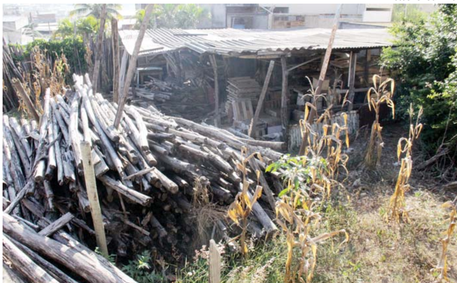
Rua Jussara (bairro Cruzeiro Celeste). Lote encontra-se há tempo fechado