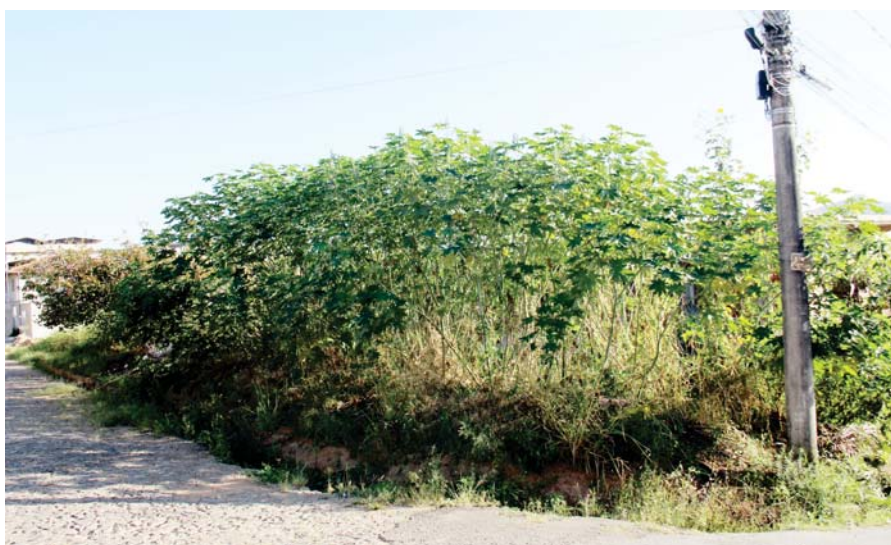
Rua Maria Teodoro de Jesus (bairro Cruzeiro Celeste). Lote sujo com objetos que acumulam água e precisando de capina