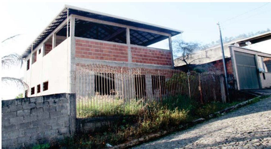
Rua Tancredo Neves (bairro Cruzeiro Celeste). Residência encontra-se abandonada com pneus, garrafas de cerveja e com varanda com telhado quebrado, com foco de Dengue

JOÃO MONLEVADE- Mesmo com a divulgação de que a dengue é uma doença perigosa e que pode até matar, muitas pessoas em João Monlevade se negam a contribuir para frear o avanço dessa epidemia em nossa cidade. Basta uma volta pelos bairros para flagrarmos lotes particulares sujos, com lixo e cheios de materiais que acumulam água.