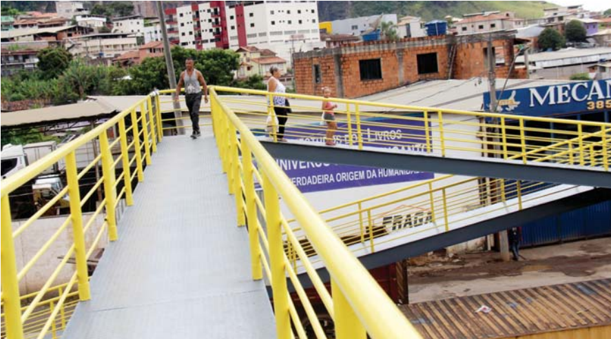
Atual administração já entregou a passarela no trevo do Cruzeiro Celeste a população toda reformada com material resistente e pintura nova.

JOÃO MONLEVADE- Foram necessários 20 anos para que as passarelas na Região recebessem manutenção, garantindo confiança aos pedestres. A atual administração já entregou à população a passarela no trevo do Cruzeiro Celeste, totalmente reformada, com material resistente e nova pintura. As reformas também começaram na passarela do trevo do Bairro Santo Hipólito, que conecta o bairro Sion à Avenida Alberto Lima.