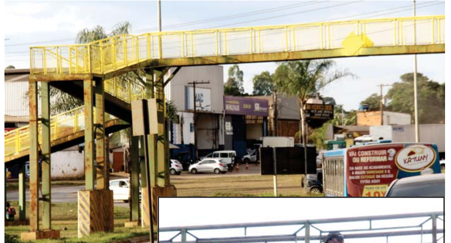
Passarela do Trevo do Bairro Santo Hipólito ligando o bairro Sion e Avenida Alberto Lima também iniciaram as reformas