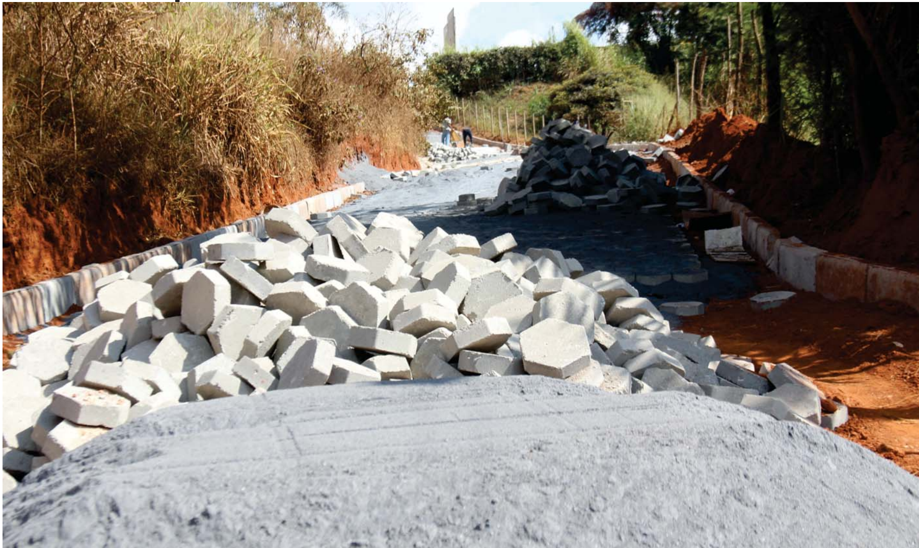
Prefeitura dá andamento a obra histórica da rua Camélia, no bairro Campos Elíseos