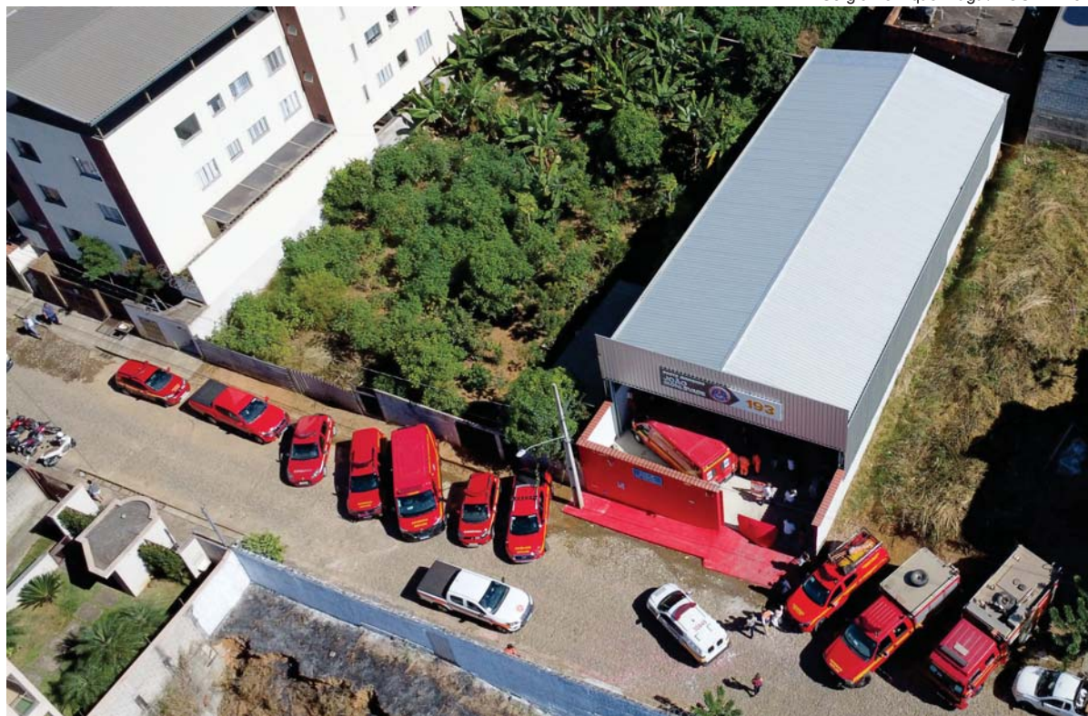
A unidade do Corpo de Bombeiros fica na Rua Castanheira, 410 - Sion, João Monlevade

É importante ressaltar que, embora a presença dos Bombeiros seja crucial para a segurança e bem-estar da população, é a Prefeitura que irá arcar com os custos operacionais da unidade. Um investimento significativo de quase R$ 2,5 milhões foi destinado para garantir o funcionamento da fração pelos próximos 60 meses. Este valor substancial é apenas uma peça do quebra-cabeça finan-