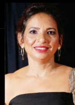
Ornação Floricultura São José (Tita)