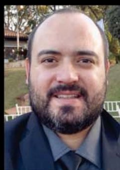
Eyder (Nu Grau - Chopp)